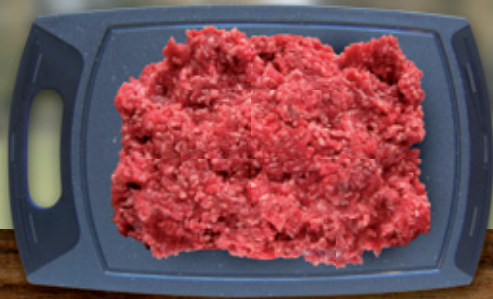
Rindermett / -Hack