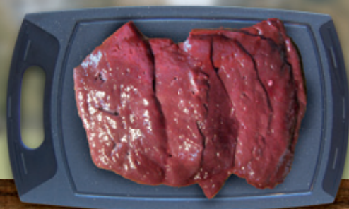
Leber sauber gezogen und fein geschnitten