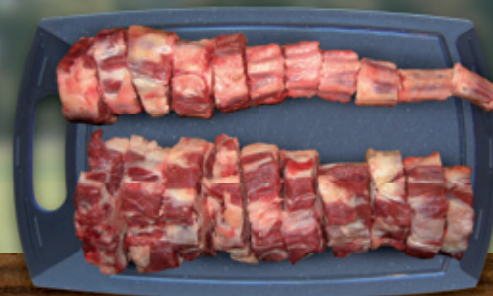
Ochenschwanz gesägt als Basis der berühmten Ochenschwanzsuppe