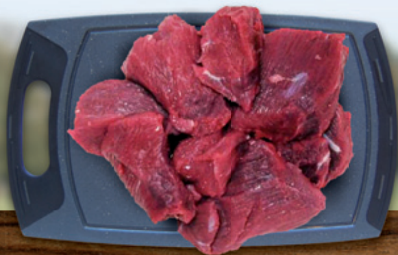
Schieres mageres Fleisch ohne Fett RI

RI für Tartar RII für Gehaktes RIII+IV für die Wurst