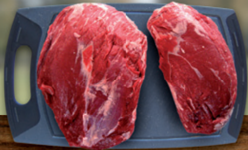
Die zwei Teile des Kugelbratens