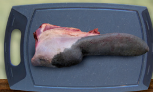
Zunge z.B. in Madeira

nach Großmutter's Art, mit Zwiebelringen und Äpfeln.