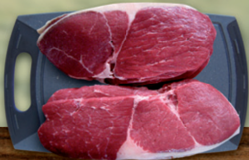
Rouladen aus der Unterschale (klass. aus Oberschale)