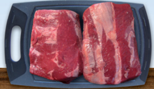
Das Roastbeef oder Rumpsteak