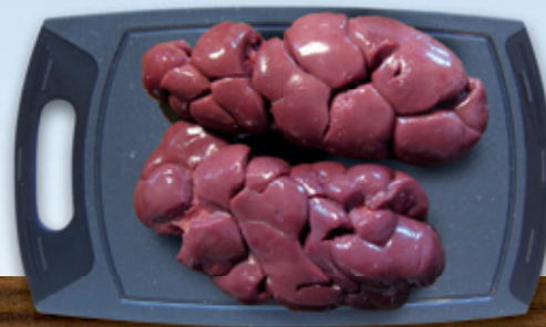
Nieren für Nierensuppe oder Niere sauer